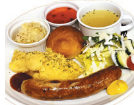
内子豚のドイツソーセージランチ(1,250円)

ドイツ人シェフが自身の母親から受け継いだ料理を提供。ランチ営業は土・日曜日限定で、プレートランチ2種類、各10食限定。ノンアルコールのドイツビールやワインも揃える。●営業時間/11:30～L.O.14:00(土日限定)、17:00～L.O.21:00●休日/水曜日●駐車場/2台●住所/愛媛県喜多郡内子町内子2885●TEL/0893-44-2900