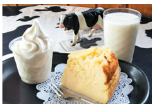
チーズケーキセット(700円)

日本三大カルストのひとつ、四国カルストの西端、標高1,408mの場所にある牧場。新鮮なミルクを使ったソフトクリーム、朝しぼり牛乳、みるくプリン、チーズケーキなどが味わえる。●営業時間/10:00～17:00(冬期16:00まで)●休日/不定休(冬期は平日休み)●駐車場/10台●住所/愛媛県西予市野村町大野ヶ原280-1●TEL/0894-76-0739