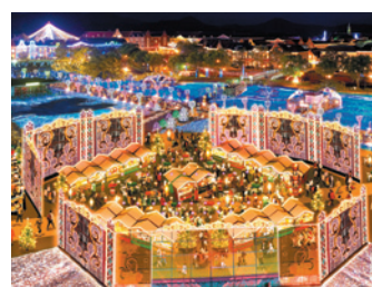
光のクリスマスマーケット

クリスマスシーズンは憧れのテーマパークで贅沢に。パーク全体が世界最大1,300万球のイルミネーションに包まれ、それだけでも感動的なのに、12月25日(火)まで日本最大のクリスマスマーケットが開催中。たくさんの光とともにグルメやショッピングが楽しめます。光のショーなども行われるので、着いたら開催時間をチェック。夕方からはアトラクションや街並み、夜はディナーを楽しんでスペシャルに過ごしましょう。