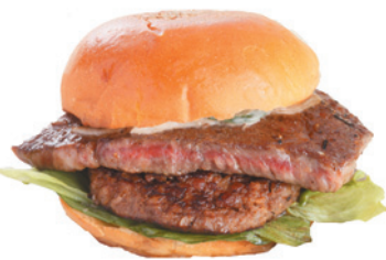
長崎和牛A5モモステーキ 1,300円(税込)

駐留米軍の影響で1950年(昭和25年)頃からつくられ始めた佐世保バーガー。せっかく味わうなら精肉店が営む「バーガーショップあいかわ」で。パティに使用している長崎和牛は社長自らが市場で競り落とした新鮮なもの。肉厚ジューシーなハンバーガーが楽しめます。「焼肉あいかわ」と「肉のあいかわ直売所」併設。直売所からステーキを配達してもらえば、自宅でのクリスマスパーティを豪華に、おいしく演出できます。