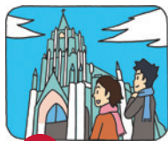
1 平戸ザビエル記念教会

●住所/長崎県佐世保市ハウステンボス町1-11 ●アクセス/西九州自動車大塔ICから車で約10分 ●駐車場/5,000台(1回800円) ●営業時間/9:00~22:00(時期により異なる) ●入場料/光のナイト散策チケット18歳以上4,100円 ※午後5時から利用できる入場券 ●休日/無休 ●TEL/0570-064-110