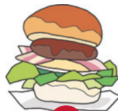
3 バーガーショップあいかわ