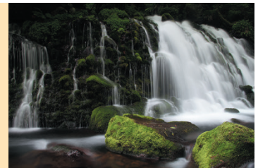
滝見を満喫したら、鳥海ブルーラインで山形へ。広大な鳥海山麓、眼下に広がる庄内平野や日本海の絶景ドライブが楽しめます。

東北で2番目に高い鳥海山からの伏流水が溶岩層の岩肌から大量に湧出している様子は圧巻。高さは5メートルほど高くはありませんが、幅30mの水の流れる斜面に息づく緑の苔としびきをあげる水とのコントラストが美しい滝です。アクセスには、秋田県にかほ市から山形県遊佐町まで、海拔ゼロ地点から標高1,100mまでかけのほる全長34.9kmの山岳観光道路「鳥海ブルーライン」がおすすめ。