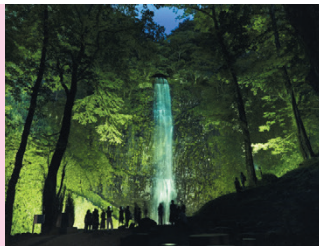
県道59号とクロスする「庄内こばえちやライン」は、鶴岡市から遊佐町をつなぐ庄内東部広域農道で、広々とした庄内平野の景色が楽しめます。

1200年ほど前に弘法大師が神のお告げにより発見し、命名したといわれる県内随一の直瀑「玉簾の滝」。かつては山岳宗教の修験場だったこともあり、滝の前には「御嶽神社」が祀られていて、厳かな雰囲気。お盆の時期にはライトアップも実施され美しい姿が見られます。県道366号で玉簾の滝に向かう途中にある「不動の滝」は「開運出世の滝」とも言われ、見応えがあるのでこちらにもぜひお立ち寄りください。