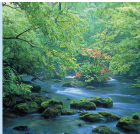
奥入瀬溪流沿いの国道102号線をたどり、そのまま十和田湖ドライブもおすすめ

青森・秋田の両県にまたがる十和田湖から流れ出る奥入瀬川。十和田湖畔から約14km続く奥入瀬溪流沿いには車道と遊歩道が整備されていて、木漏れ日を浴びながらドライブも散策もできるところが魅力です。焼山から子ノ口へと上流に向かうドライブルートがおすすめ(約40分)。見どころは多数ありますが、途中の駐車場からアクセスできる「三乱の流れ」「石ケ戸の瀬」「銚子大滝」は必見。名所以外でも、苔が作り出す自然美も堪能できます。