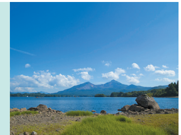
西吾妻スカイバレーは、山形県米沢市白布温泉と松原湖北岸を結ぶ全長17.8kmの山岳道路。※4月中旬~11月上旬のみ開通。開通期間も夜間は通行止めになる場合もあり。

裏磐梯には、磐梯山の噴火により誕生した湖が多数あり、中でも最も大きいのが「松原湖」です。湖内には大小さまざまな島が点在していて、その雄大で美しい景色は時間を忘れて見とれるほど。また、大自然のパワーが感じられる磐梯山の爆裂口の跡が見られるほか、吊り橋のある松原湖畔遊歩道では、約60分の散策が楽しめます。アクセスには、ヘアピンカーブの爽快ドライブが楽しめる「西吾妻スカイバレー」がおすすめです。