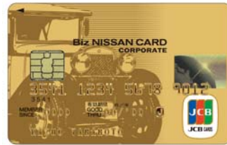
Biz NISSAN CARD(ゴールドカード)

「Biz NISSAN CARD」は、法人のお客さまの様々なビジネスシーンをバックアップしていく多彩なサービスをご提供します。