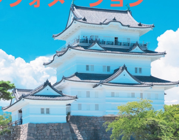
神奈川県・小田原城