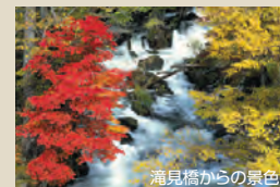
滝見橋からの景色