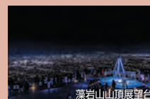
藻岩山山頂展望台