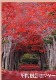
平岡樹芸センター

真っ赤なモミジが見事な穴場紅葉スポット「平岡樹芸センター」をスタートに、「支笏湖」を経由し、都会のオアシスと称される「中島公園」で紅葉散歩を愉しんだら、札幌市が一望できる「藻岩山」へ。藻岩山中腹まで有料道路・藻岩山観光自動車道でアクセスし、駐車場に車を停めます。ミニケーブルカーで山頂展望台まで移動し、日本新三大夜景にも選出されている美しい夜景を堪能します。